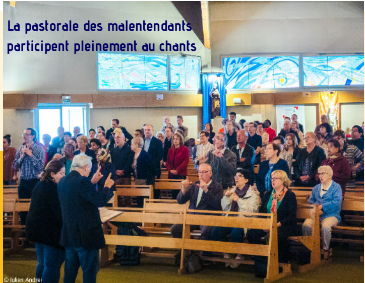
La pastorale des malentendants participent pleinement au chants

Le 12 novembre 2023 Le Comité des Fêtes de Saint-Urbain peut enfin organiser le repas du 50ème anniversaire de l'Eglise • 10h30 - Messe suivie d'un moment convivial autour d'une choucroute garnie (fromage - dessert - café compris) (Animation - tombola) • Une participation est demandée : 21€ par personnes 12€ pour les enfants de moins de 12 ans INSCRIPTION avant le 7 novembre 2023 au Secrétariat Saint-Urbain ou mettre le talon réponse dans la boîte aux lettres avec le règlement