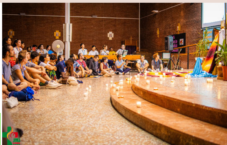
Temps de prière des jeunes aux JMJ

S.-Léon : Le première vendredi du mois après la messe de 15h Vendredi à 13h15 avec les enfants de l'école Herrade