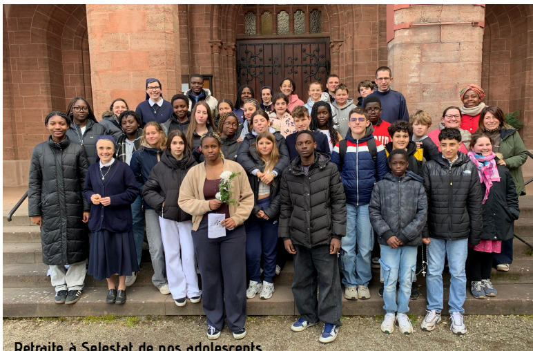
Retraite à Selestat de nos adolescents

Seigneur Jésus, Toi qui viens à la rencontre de chacun en murmurant : « Si tu savais le don de Dieu... », Ouvre nos cœurs à la beauté de ton appel. Nous te confions ceux qui ont déjà répondu à ta voix, particulièrement les prêtres, les religieuses et les religieux : Fortifie leur fidélité, renouvelle leur joie, Et fais d'eux des témoins paisibles et lumineux de ta présence. Que leur vie donnée révèle au monde la douceur de ton amour et la profondeur du don qu'ils ont reçu. Nous te prions aussi pour les jeunes qui hésitent, ceux qui cherchent leur chemin sans encore oser s'avancer, ceux que tu appelles en secret et qui n'ont pas encore reconnu ta parole, Qu'ils découvrent, à travers la prière, les sacrements et la rencontre, que ta volonté est source de liberté et que chaque vocation, dans sa forme propre, est une manière unique de laisser ton don se déployer. Seigneur, fais grandir en ton Eglise des cœurs disponibles, attentifs à ton souffle discret. Accorde à chacun la grâce de se savoir aimé, appelé et envoyé selon ton dessein d'amour. Et que, dans la diversité des chemins où tu nous conduis, nous portions tous au monde la joie de te suivre. Amen.