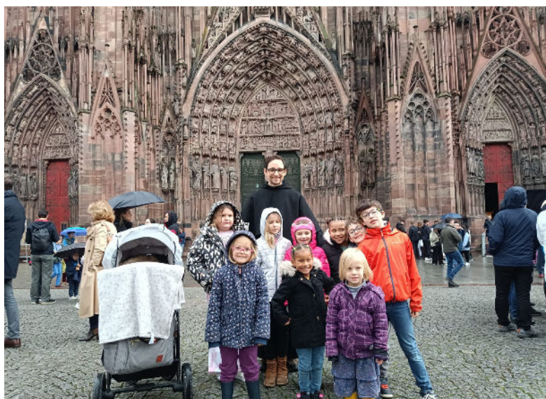
Vacances et HT : à la cathédrale et carrousel.