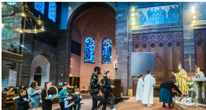
Fête de Saint Jean Paul II à Saint-Aloyse