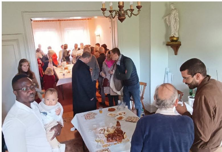
fête patronale à Saint-Léon