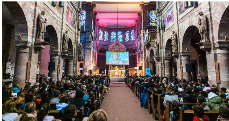
Sacrée journées à Saint-Aloyse avec 365 écoliers

Il s'est révélé comme un Père aimant, et en donnant à son Fils un temple vivant et fluide qui nous attire à la sainteté, il a fait de nous des enfants en Lui, cohéritiers du patrimoine de sainteté qui n'est plus réservé à la prérogative du Très-Haut. Un itinéraire donc de rapprochement total, de proximité et de relation, qui transforme et réalise notre nouvelle et pleine identité. Avec la venue de Jésus, sa mort et sa résurrection, le don de l'Esprit Saint qui habite désormais aussi en chacun de nous en vertu du baptême, nous sommes « concitoyens des saints et membres de la famille de Dieu » (Ep 2, 19). Quelle immense dignité ! Quelle révélation touchante ! Le voile de notre indignité nous a été enlevé et le diadème royal de notre élection comme enfants préférés nous a été remis.