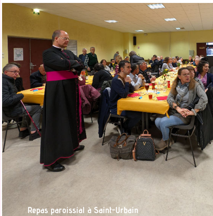
Repas paroissial à Saint-Urbain