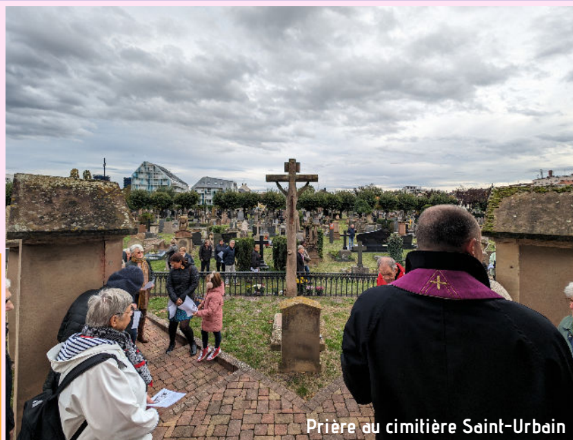
Prière au cimetière Saint-Urbain

D'autres horaires sur notre site internet