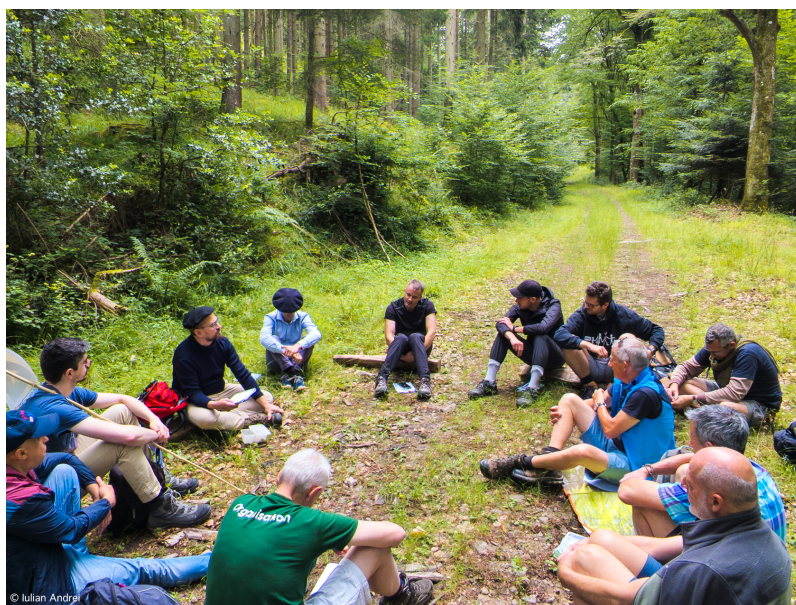
Pèlerinage des pères de familles

KT1 : Année 1 - CE1; KT2 : Année 2 - CE2; KT3 : Année 3 - CM1; KT4 : Année 4 - CM2