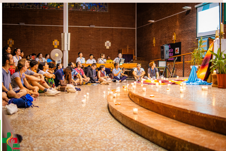
Temps de prière des jeunes aux JMJ