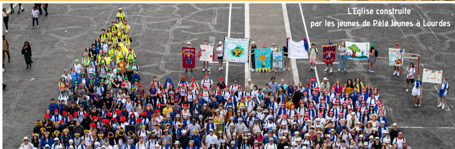
L'Eglise construite par les jeunes de Pèlé Jeunes à Lourdes