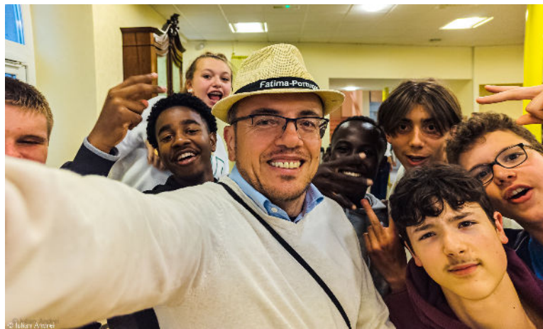
Week-end adolescents à Saint-Jean de Bassel. 97 jeunes ont réfléchi sur l'amour de Dieu pour eux. Merci pour votre soutien.